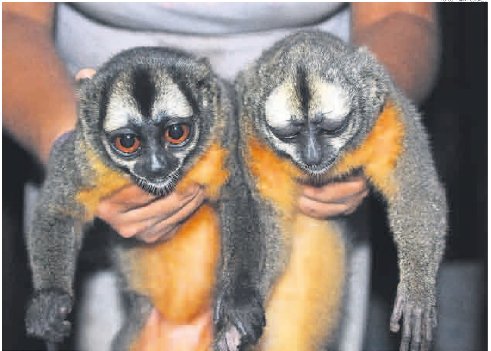
SUSTRACCIÓN ILEGAL. Los monos nocturnos de la especie 'Aotus nancymaae' se encuentran al sur del río Amazonas, entre Perú y Brasil. Los caracteriza su pelaje anaranjado en el pecho.