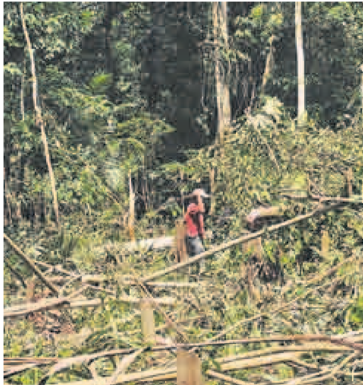
DAÑOS AMBIENTALES. Para cazar al mono nocturno los pobladores de la frontera deforestan alrededor de su madriguera.

La denuncia de Maldonado ha llegado a los tribunales colombianos. La Fiscalía de Leticia investiga el instituto de Patarroyo por tráfico de especies y, en abril de este año, el Tribunal Administrativo de Cundinamarca admitió una acción popular contra el mismo instituto. El caso está en