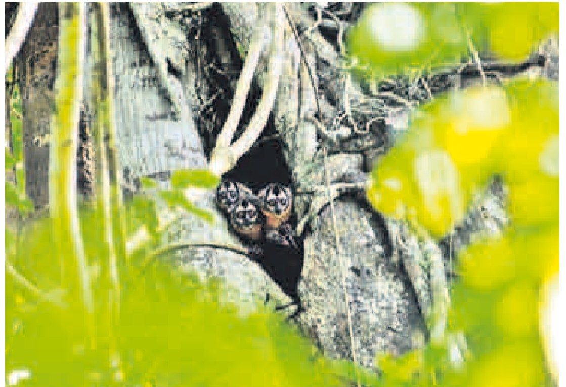
PRESIÓN A LA ESPECIE. Luego de talar alrededor del árbol en el que se encuentra la madriguera, uno de los cazadores trepa para asustar a los primates. Ellos saltarán y caerán en las redes.